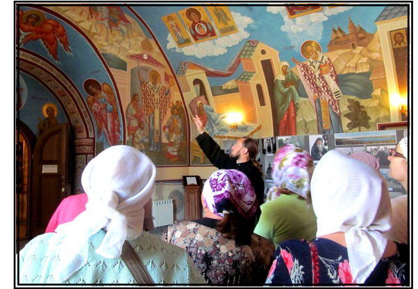
Наши паломники в Абалакском монастыре.

Это было первым чудом от сего образа. Очень быстро весть о явлении чудотворной иконы распространилась не только по Сибири, но и по всей России. Только в XVII веке было записано более 130 случаев благодатной помощи от чудотворной иконы. Абалакский монастырь и сегодня остаётся одним из главных духовных центров Сибири.