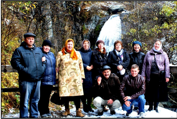
Алтайский заповедник. Водопад Корбу.