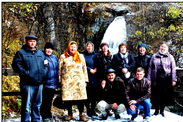
Алтайский заповедник. Водопад Корбу.