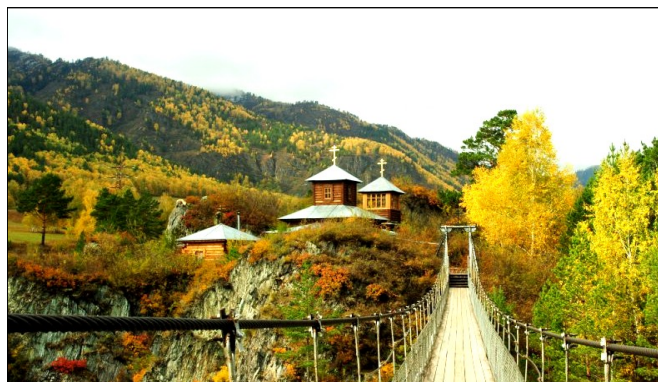
Чемал, остров Патмос. Храм Иоанна Богослова и висячий мост через р. Катунь.

Размещение в гостевом доме, баня (по желанию).